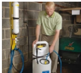
Užitečný zásobník na deionizovanou vodu